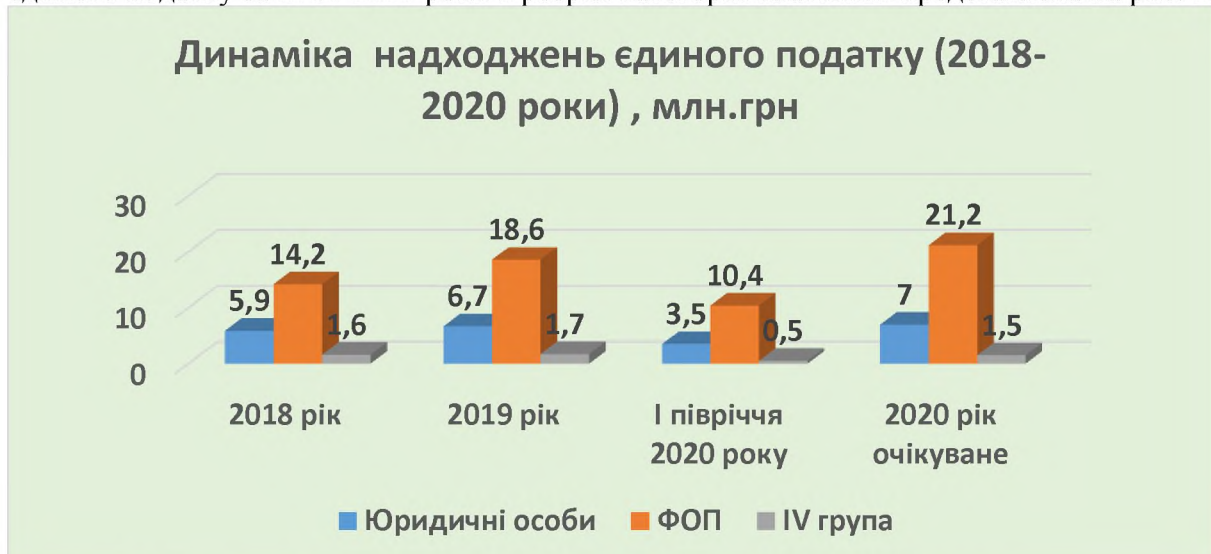
Рис. 2. Динаміка надходжень єдиного податку за 2018-2020 роки.

Так, спрощеною системою оподаткування скористалися 618 платників, у тому числі 100 юридичних осіб (III група), 480 фізичних осіб-підприємців (I-III групи) та 38 сільськогосподарських товаровиробників (IV група). Частка надходжень єдиного податку в структурі податкових надходжень зростає з 7,1% у 2018 році до 8,1 у 2020 році (очікуване). Зростання надходжень цього податку зумовлене збільшенням прожиткового мінімуму (для розрахунку єдиного податку платників I групи), мінімальної заробітної плати (для розрахунку єдиного податку платників II групи) та кількості платників, які обрали спрощену систему оподаткування та сплачують єдиний податок до місцевого бюджету. Динаміка надходжень єдиного податку за 2018-2020 роки в розрізі категорій платників представлена на рис. 2.